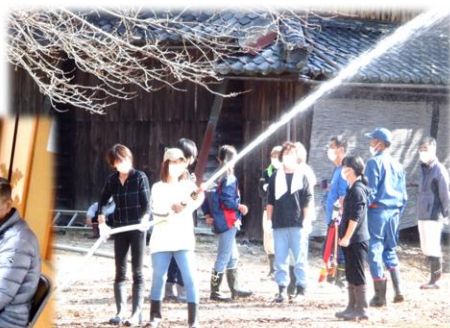
宮野自治会防災訓練の様子