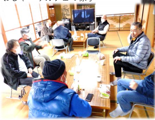
おしゃべりカフェの様子

宮野区としては、区民の皆さんの交流と協力を原動力に、共に支え合う自治会活動を展開してまいります。