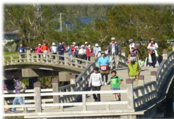
【ガリバーウォーキング】

特にスポーツの日を含む3連休の日曜日に半日で開催する「高島地域スポーツカーニバル」は、最大の事業ですが、残念ながらコロナ禍で3年間実施できていません。しかしながら今年は4年ぶりに10月8日に実施する予定で、多くの方々にご参加いただけるよう只今取り組みを始めているところです。他にもガリバーウォーキング、ビーチボール大会、ノルディックウォーキング教室、楽しいスポーツ遊び教室、元旦走ろう会などを主催し、子どもから大人までが楽しみながら健康の保持増進、体力の向上などを継続的に取り組めるようそのきっかけづくりをしています。また、既存のスポーツ団体を支援し、ゲートボール大会やグラウンド・ゴルフ大会、壮年ソフトボール大会、ビーチ