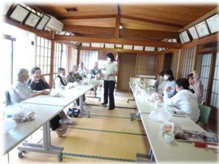
【ワンコインカフェ】

地区の氏神様であります式内宇伎多神社の式内とは神社の格式で延長5年(927年)「延喜式神名帳」(えんぎしきじんみょうちょう)の中に全国で2851社を神祇関係の法規を適用される範囲の神社として列記されている中の1社であり1000年以上の歴史があります。