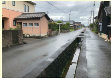
西町通りと町割り水路